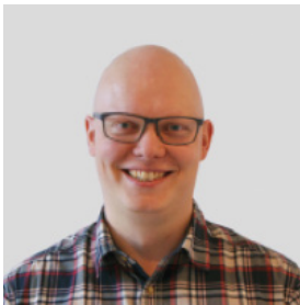
Dr. De Bo T. heup-, enkel- en voetchirurgie mcavlaanderen.wordpress.com