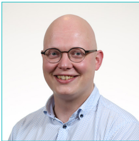
Dr. De Bo T. heup-, enkel- en voetchirurgie mcavlaanderen.wordpress.com