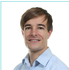
Dr. Van Parys M. schouder-, elleboog-, pols- en handchirurgie