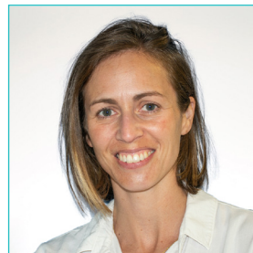
Dr. Lauwagie S. kinder- en neuro-orthopedie